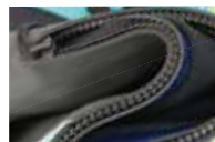
柔らかく、ストレスフリーの 軽い防水ファスナー