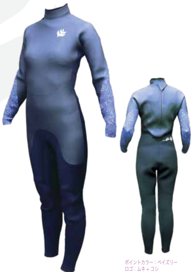
ポイントカラー：ベイズリー ロゴ：ムネ+コシ