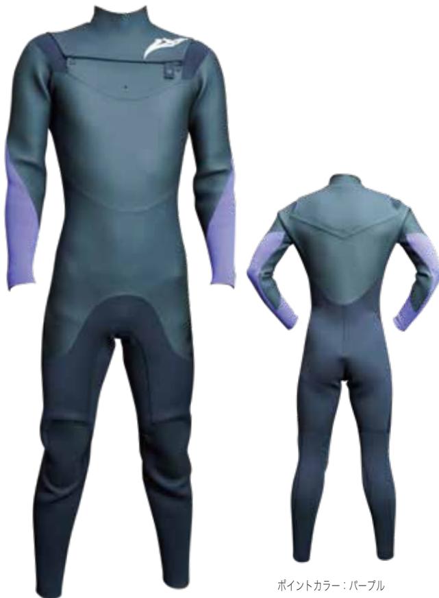
ポイントカラー：パープル