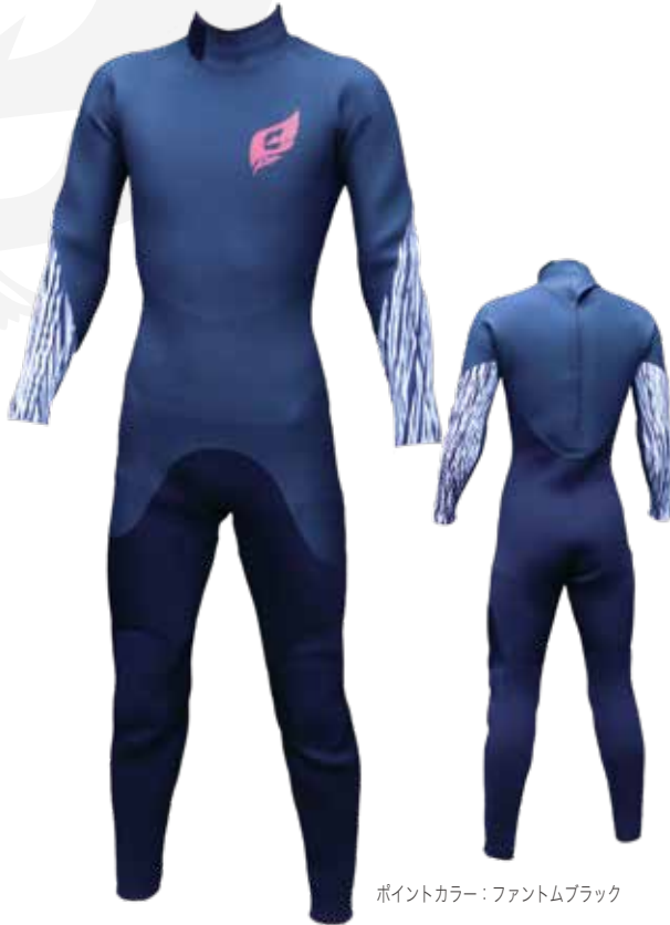
ポイントカラー：ファントムブラック