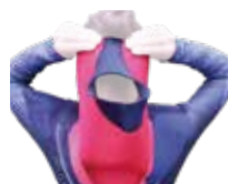
オプションのウォーターバリアー