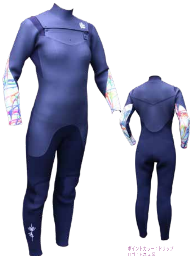
ポイントカラー：ドリップ ロゴ：ムネ+足